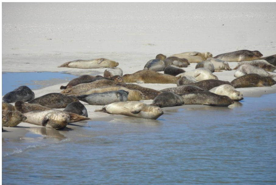
We zien de zeehonden van heel dichtbij.