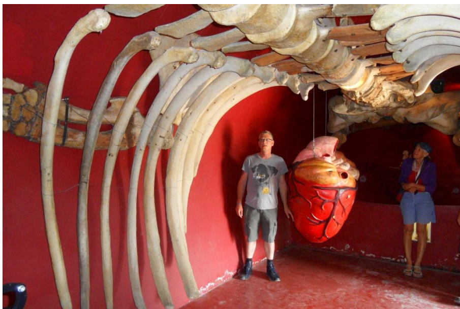
In de buik van de potvis.